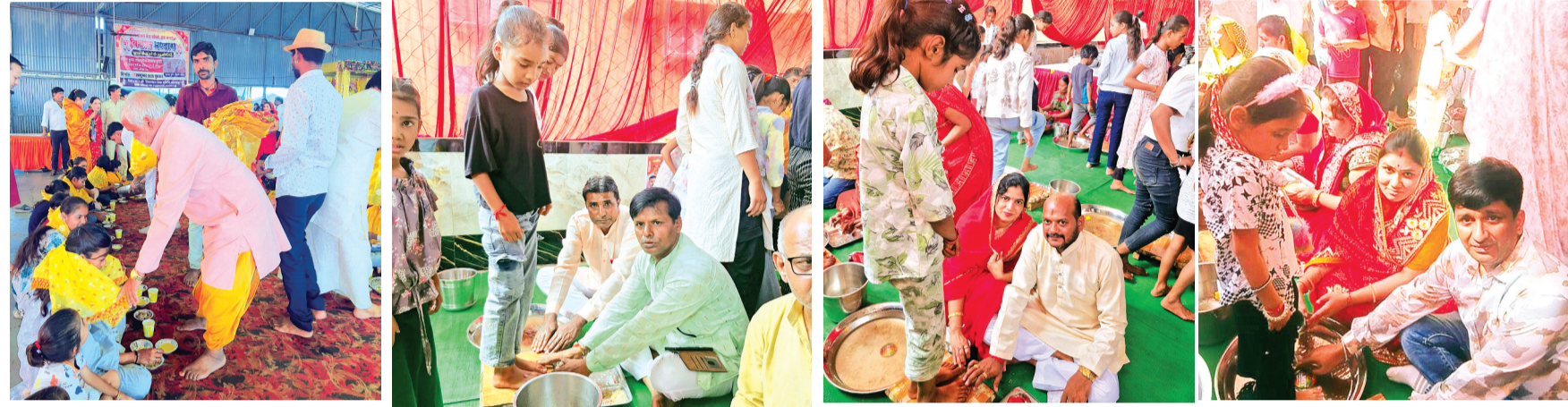
हरिभूमि न्यूज | नलखेड़ा

शारदीय नवरात्रि के अंतिम दिन बुधवार को सिद्धपीठ मां बगलामुखी मंदिर के समीप पीतांबरा सेवा समिति के भंडारा परिसर में समिति द्वारा पंद्रह सौ कन्याओं के पैर पूजकर कन्या भोज कराया गया। बुधवार को प्रातः 10 बजे से भंडारा परिसर में पीतांबरा सेवा समिति द्वारा कन्या पूजन का कार्यक्रम प्रारम्भ किया गया। समिति सदस्यों व अन्य माता भक्तों द्वारा पंद्रह सौ से अधिक कन्याओं के पैरों को पखार कर पूजन किया गया। कन्या पूजन के बाद भंडारा परिसर में कन्या भोज का आयोजन हुआ। कन्या भोज के उपरांत सभी कन्याओं को उपहार भेंट किए गए।