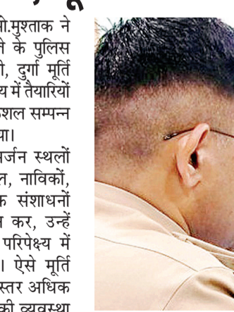
डिप्लॉयमेंट करना सुनिश्चित करे। ध्वनि नियंत्रण एवं डीजे पर निगरानी विसर्जन के दौरान डीजे/ध्वनि विस्तारक यंत्र निर्धारित ध्वनि सीमा के अंतर्गत ही बजाए जाएं। किसी भी प्रकार का अश्लील, उत्तेजक अथवा ऐसी गीत/संगीत नहीं बजने चाहिए जिससे किसी धर्म, जाति अथवा समुदाय की