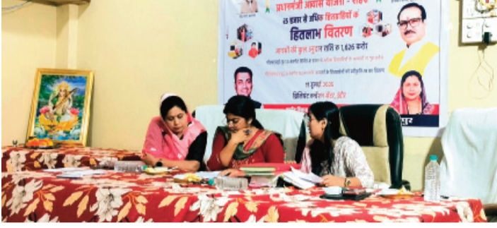
सारंगपुर परिषद की बैठक में पहुंचे 4 पार्षद