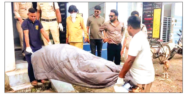
हरिभूमि न्यूज़ ▶▶ देवास

शहर के वैशाली नगर के घर में बुधवार दोपहर महिला का शव मिला। प्रारंभिक जांच में यह दो दिन पुराना बताया जा रहा है।