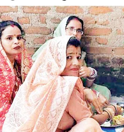
से सजाया और अलंकृत किया जाता है। इसके चबूतरों की रंगोली के समान निर्मित दुदी एवं सूखे रंगों से चौक पूरा जाता है। लड़कियों की

ललितपुर। तहसील महरौनी अंतर्गत ग्राम कुम्हैड़ी में अविवाहित बच्चियों ने अश्वनि शुक्ल प्रतिपदा से पूरे नौ दिन तक ब्रह्ममुहूर्त में गांव की चौपालों या गांव के बड़े चबूतरों पर अविवाहित बड़ी बेटियों द्वारा सरजित एक रंग बिरंगा ऐसा संसार दिखता है जिसमें एक व्यवस्था होती है, संस्कार होते हैं। रागरंग और लोकचित्रों में बुन्देली गरिमा होती है। हमारी बेटियां एक साथ गीत संगीत, नृत्य चित्रकला और मुर्तिकला, साफ-सफाई संस्कारों से मिश्रित लोकोत्सव नौरता मनाती है। दीवार एक विराट देवताकार प्रतिमा जिसका श्रृंगार चने की दाल, ज्वार के दाने, चावल, गुलाबास के फूलों