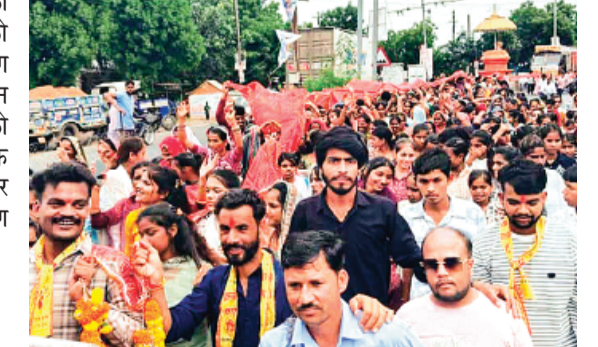
हरिभूमि न्यूज़ | राजगढ़

स्वल्पाहार व पेयजल की व्यवस्था कर यात्रा को सफल बनाने में सहयोग दिया। इस चुनरी यात्रा ने न केवल धार्मिक आस्था को प्रकट किया, बल्कि आपसी भाईचारे और एकता का अद्भुत उदाहरण भी प्रस्तुत किया।